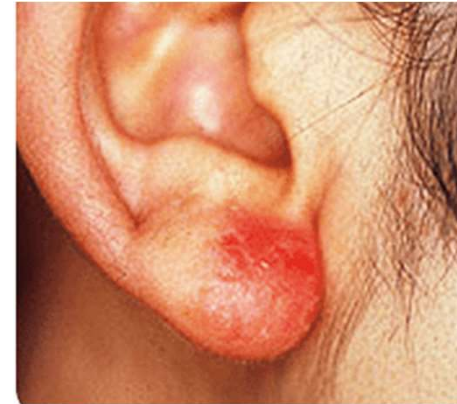
イヤリングによる接触皮膚炎