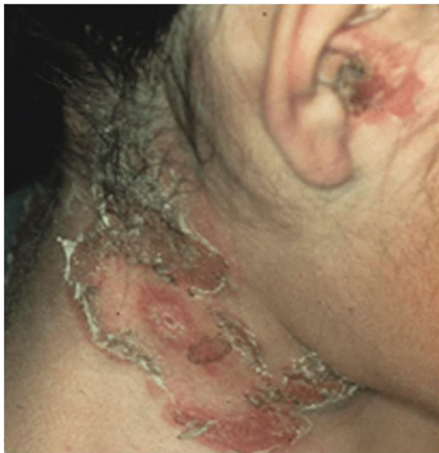
水疱性のとびひ(水ぶくれができる)