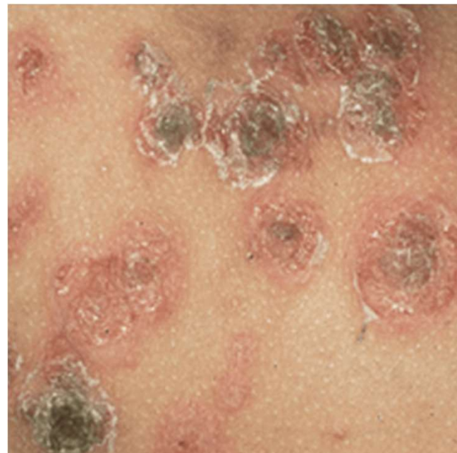
痂皮性のとびひ(かさぶたができる)