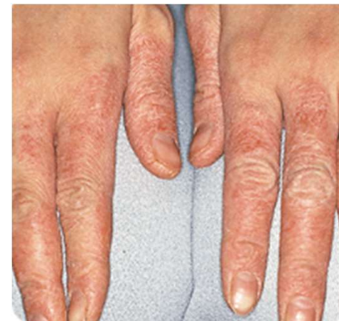
水仕事による手湿疹