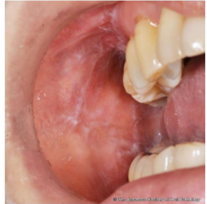
日本臨床口腔病理学会 口腔病理基本画像アトラス

✓ 痒い赤～紫の複数のプツプツ（丘疹）ができ、融合して鱗屑を伴う扁平な台地状（苔癬）になっている。皮膚を掻くと新たにできる。口の中の頬の粘膜が白くただれができています。