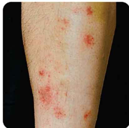
ドライスキンによる掻き壊し