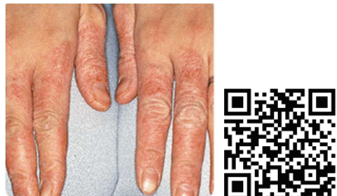
水仕事による手湿疹