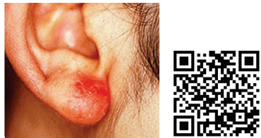
イヤリングによる接触皮膚炎

✓ 主婦湿疹(手湿疹)は、お湯や洗剤等により脂が奪われ、バリア機能が低下して起こる。