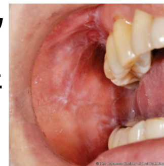
日本臨床口腔病理学会 口腔病理基本画像アトラス

✓ 痒い赤～紫の複数のプツプツ（丘疹）ができ、融合して鱗屑を伴う扁平な台地状（苔癬）になっている。皮膚を掻くと新たにできる。口の中の頬の粘膜が白くただれができています。